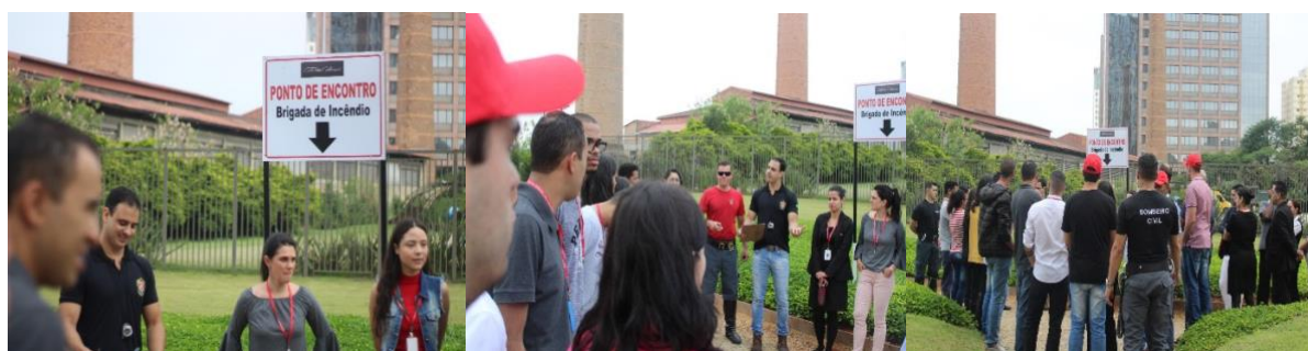
REUNIÃO EXTRAORDINÁRIA COM OS BRIGADISTAS APÓS O ABANDONO