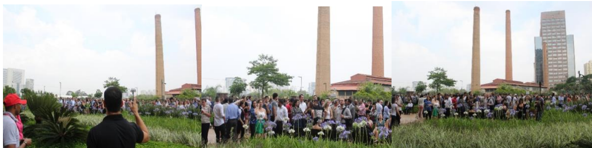
CONCENTRAÇÃO NO PONTO DE ENCONTRO