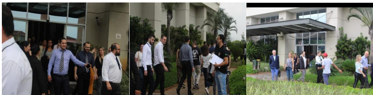
POPULAÇÃO SENDO ENCAMINHADA PARA O PONTO DE ENCONTRO

WD CONSULTORIA E PRESTAÇÃO DE SERVIÇOS LTDA. CNPJ: 19.924.720/0001-71 I.E: 312.060.511.112