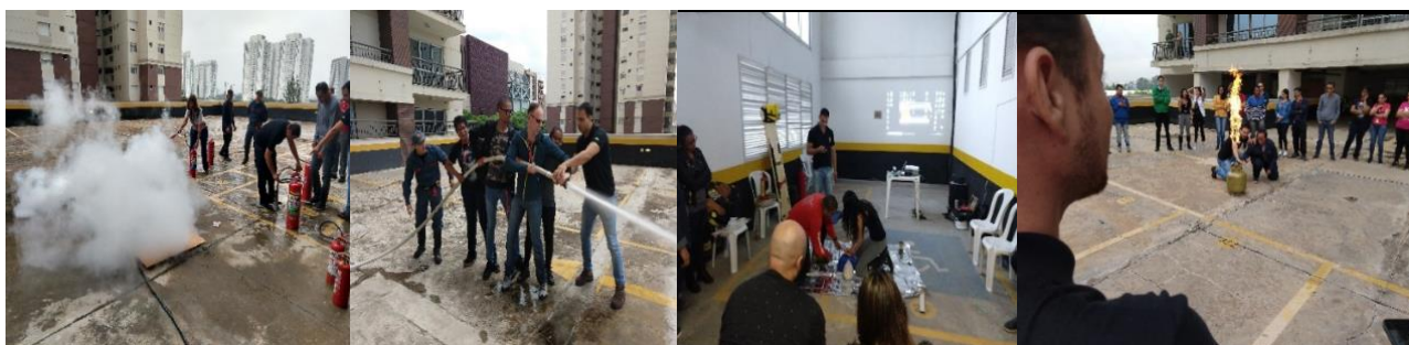
FORMAÇÃO DA BRIGADA DE INCÊNDIO

WD CONSULTORIA E PRESTAÇÃO DE SERVIÇOS LTDA. CNPJ: 19.924.720/0001-71 I.E: 312.060.511.112